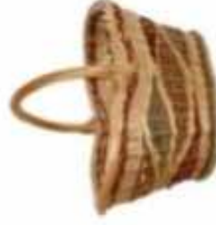
PANIER ● ○ ○