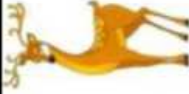
CERF ● ○ ○