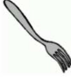
FOURCHETTE ● ○ ○