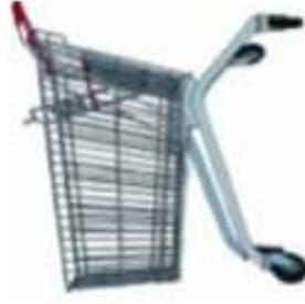
CHARIOT ● ○ ○