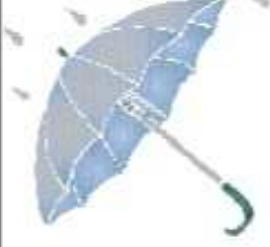
PARAPLUIE ● ○ ○