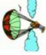
PARACHUTE ● ○ ○