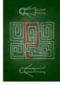
LABYRINTHE ● ○ ○