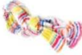
FOULARD ● ○ ○