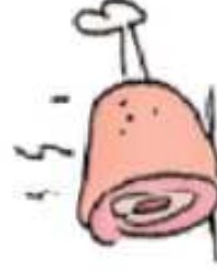
GIGOT ● ○ ○