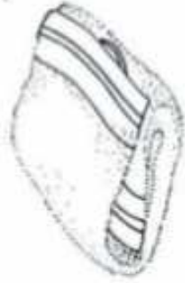
SERVIETTE ● ○ ○