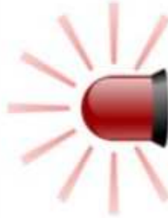
GYROPHARE ● ○ ○