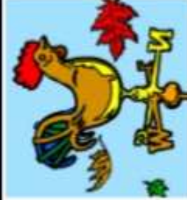
GIROUETTE ● ○ ○