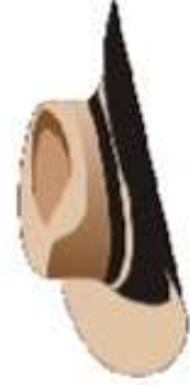
CHAPEAU ● ○ ○