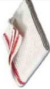
SERPILLÈRE ● ○ ○